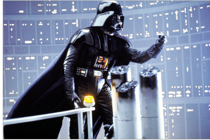
Doc. 1 Dark Vador dans Star Wars , épisode V : L'Empire contre-attaque .